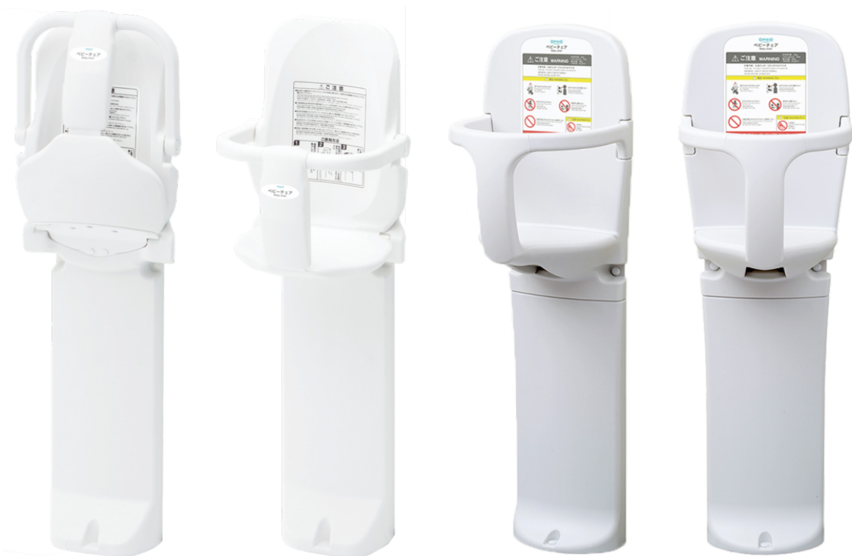
収納式ベビーチェア まっててねFN TS-FN

ベビーチェア「まっててね」も収納式のFNと固定式のH1を展示。 使い勝手や設置スペースの違いを比べて下さい。 オモイオならではの標準での平面・コーナー取付や、旧機種との互換性についてもご 説明致します。