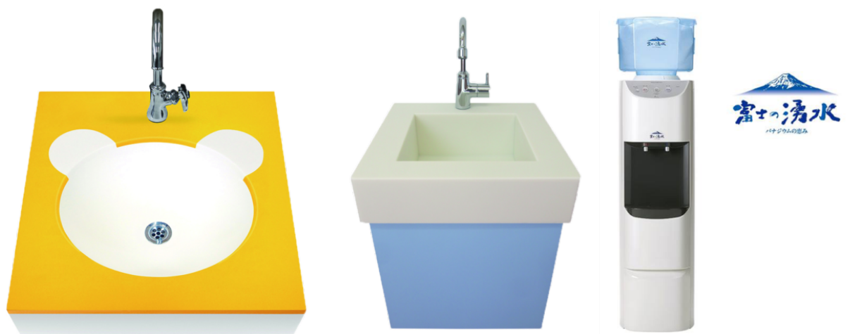
キッズ洗面台 アニマルシリーズ クマ キッズ洗面台 ベーシックシリーズ 「富士の湧水」ウォーターサーバー

新規取り扱いのキッズ洗面台や、授乳室に最適な、「富士の湧水」ウォーターサーバーも、もちろん展示します。ウォーターサーバーは試飲も可能です。まろやかな天然水の美味しさを是非ご賞味下さい。